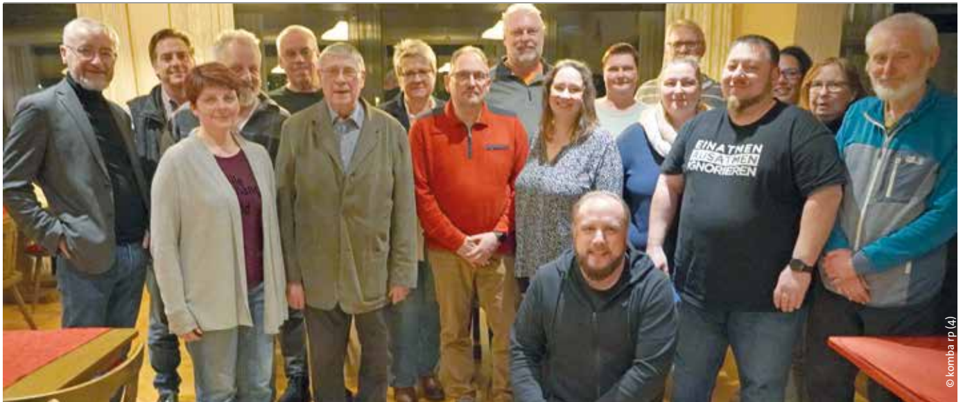
Mitglieder des Vorstandes des komba Verbandes Rheinpfalz e. V.